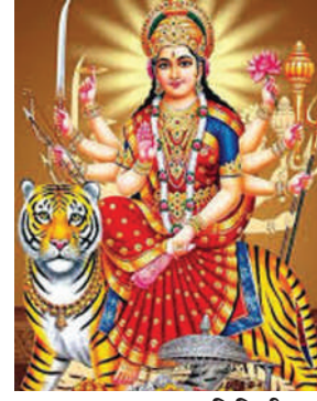
महासागर प्रतिनिधी अमरावती, (दि. 27)

नवरात्रोत्सवाला 3 ऑक्टोबरपासून सुरुवात होत आहे. त्यामुळे नवदुर्गा व शारदा देवी मंडळांच्या जय्यत तयारी सुरु झाल्या आहेत. अमरावती शहरातील दहा पोलिस ठाण्यांच्या हद्दीत यंदा 492 दुर्गा तर 102 शारदा देवी मुर्तीची स्थापना होणार असून, 64 ठिकाणी रास गरबा खेळला जाणार आहे. या अनुषंगाने पोलिसांनी बंदोबस्ताचे नियोजन केले असून, महिलांच्या सुरक्षेच्या अनुषंगाने चोख बंदोबस्त लावण्यात येणार आहे. नवरात्रोत्सवाचा दरवर्षी उत्साह शिगला पोहोचतो. खास करून महिलांमध्ये प्रचंड उत्साहाचे वातावरण पाहायला मिळते. नवदुर्गा व शारदा देवी