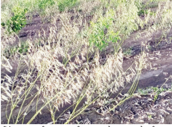
शिंपडल्यासारखी आली. बळीराजाने छातीला माती लावून काळ्या आईच्या कुशीत बियाणे पेरले. नंतर पर्जन्याचा मेहेरबान

महासागर प्रतिनिधी पथोट, (दि.28) - परतीच्या पावसाने हातातोंडाशी आलेला घास हिरावल्याने शेतकऱ्यांची चिंता वाढली असून कापसाच्या वाती, तुरीच्या तुराट्या आणि सोयाबीन, संत्राझाडे वांझोटी झाली आहे. परतीच्या पावसाने खरीपातील पिकांचे अतोनात नुकसान केल्याने मदतीची याचना शेतकरी शासनाकडे करीत आहे. खरीपातील लागवडीसाठी सुरवातीला अपेक्षित समाधानकारक पाऊस पडला नाही, सुरवातीचे नक्षत्र कोठे बरसली, तर कोठे नुसती