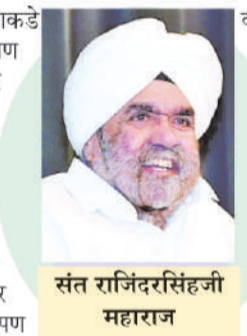
संत राजिंदरसिंहजी महाराज

विचार, प्रत्येक बोल आणि प्रत्येक कृती परमेश्वराला माहीत असते. आपण याला एक कॉम्प्युटर नेटवर्क प्रमाणे विचार करू शकतो. जो मास्टर कॉम्प्युटर अथवा मुख्य कॉम्प्युटर असतो, तो नेटवर्क च्या बाकी कॉम्प्युटर बरोबर जोडलेला असतो. जो ऑपरेटर मुख्य कॉम्प्युटरवर काम करीत असतो, तो प्रत्येक कॉम्प्युटर मध्ये काय चालू आहे, त्याची सर्व माहिती पाहू शकतो. नेटवर्कच्या इतर कॉम्प्युटरला हे माहीत नसते, कि मुख्य कॉम्प्युटर ऑपरेटर इतर कॉम्प्युटर चालणारी सर्व माहिती असते. जर त्यांना हे माहीत आहे कि त्यांना कोणाचा ई-मेल किवा टेक्स्ट मेसेज उघडून पाहण्याची परवानगी आहे, तर ते कदाचित अधिक सावध राहतील. परंतु ते वा गोष्टी पासून अनभिज्ञ असतात आणि ते असे काही लिहितात, टाईप करतात कि जे कोणालाही सांगावयाचे नसते . अशा प्रकारे परमात्मा सुध्दा, सृष्टीचा नेटवर्कचा मुख्य कॉम्प्युटर ऑपरेटर आहे आणि आपला आत्मा त्या नेटवर्क मधील बाकी कॉम्प्युटर शी जोडलेले आहे. जो पण आपण विचार करतो, बोलतो आणि कार्य करतो, ते सर्व परमात्म्याला माहीत असते. जर आपणास या गोष्टीची जाणीव झाली कि परमात्मा आपल्याला संदेव पाहत आहे, आपले विचार आणि शब्द ऐकत आहे आणि आपली कृती पाहत आहे, तर विचार करा कि आपल्या वागणुकीत लवकरात लवकर सुधारणा होईल. आपण या गोष्टीवर खूप लक्ष दिले पाहिजे कि आपण अहिंसा, सत्यता, पवित्रता आणि नम्रता इत्यादि गुणांच्या बाबतीत उल्लंघन करणार नाही. जर आपण आपल्या चुका सुधारल्या, दरोजे ध्यान-अभ्यासासाठी वेळ दिला आणि न्यायाने सेवा पण केली, तर निश्चित रूपाने आपली अध्यात्मिक प्रगती खूप वेगाने होईल.