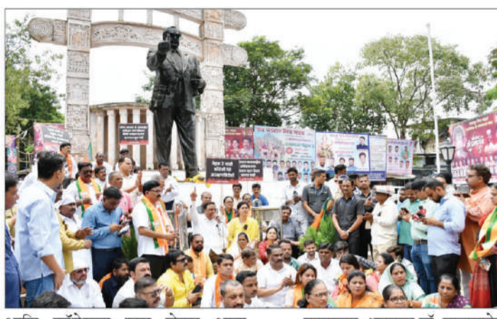
आणि काँग्रेसचा खरा चेहरा आता जनतेसमोर उघड झालाय आणि महाराष्ट्राची जनता येणाऱ्या निवडणुकांमध्ये काँग्रेसला याच उतर नक्कीच देईल.

■ महासागर प्रतिनिधी मुंबई दि. १४ः राहुल गांधी यांनी अमेरिकेत केलेल्या आरक्षण रद्द करण्याच्या वक्तव्याच्या निषेधार्थ आज भाजपा अनुसूचित जाती मोर्चा मुंबईच्या वतीने भाजपाच्या राष्ट्रीय सचिव आमदार पंकजाताई मुंडे आणि मुंबई भाजपा अध्यक्ष आमदार अॅड आशिष शेलार यांच्या प्रमुख उपस्थितीत घाटकोपर येथील माता रमाबाई नगर मधील भारतरब् डॉ. बाबासाहेब आंबेडकर यांच्या पुतळ्याजवळ आंदोलन करण्यात आले.