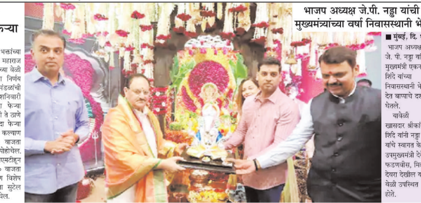
भाजप अध्यक्ष जे. पी. नड्डा यांनी मुख्यमंत्र्यांच्या वर्षा निवासस्थानी भेट देत बापाचे दर्शन घेतले.

मुंबई, दि. १४ः गणेशोत्सवा दरम्यान गणेश भक्तांच्या सोयीसाठी मध्य रेल्वेने छत्रपती शिवाजी महाराज टर्मिनस आणि ठाणे / कल्याण दरम्यान रात्रीच्या वेळी लोकलच्या २२ जादा फेऱ्या चालवण्याचा निर्णय घेतला आहे. सार्वजनिक गणेशोत्सव मंडळांची विनव्या लक्षात घेऊन मध्य रेल्वेने शनिवारी मध्यरात्रीपासून मंगळवारी रात्रीपर्यंत जादा फेऱ्या चालवण्याचा निर्णय घेतला आहे. सीएसएमटी ते ठाणे / कल्याण दरम्यान मुख्य मार्गावर या जादा फेऱ्या चालवण्यात येणार आहेत. सीएसएमटी झ कल्याण विशेष लोकल सीएसएमटीहून रात्री १.४० वाजता सुटेल आणि कल्याणला रात्री ३.१० वाजता पोहोचेल. आपखी वाचा ठाणे विशेष लोकल सीएसएमटीहून रात्री २.३० वाजता सुटेल आणि रात्री ३.३० वाजता टाण्याला पोहोचेल. सीएसएमटी - कल्याण विशेष लोकल सीएसएमटीहून रात्री ३.२५ वाजता सुटेल आणि कल्याणला पहाटे ४.५५ वाजता पोहोचेल.