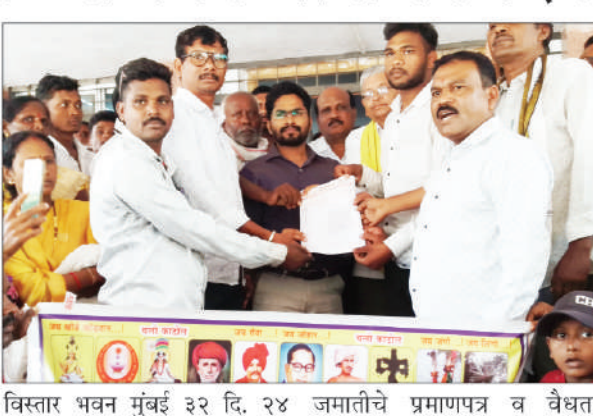
विस्तार भवन मुंबई ३२ दि. २४ एप्रिल १९८५ मधील गोंड गोवारी जमाती बद्दलची चुकीची माहिती वगळून त्याठिकाणी सुप्रिम कोर्टाच्या दि. १८.१२.२०२० च्या निकालातील मुद्दा क्र. ८३ मधील सांस्कृतिक माहिती व इतर संदर्भ ग्रंथाप्रमाणे दुरुस्ती करून सविधानिक गोंड गोवारी जमातीला त्यांचे सन १९५० महसुली पुरावे जरी गोवारी असे असले तरी त्यांना सविधानिक तरतुदीनुसार विनाविलंब गोंड गोवारी अनुसूचित