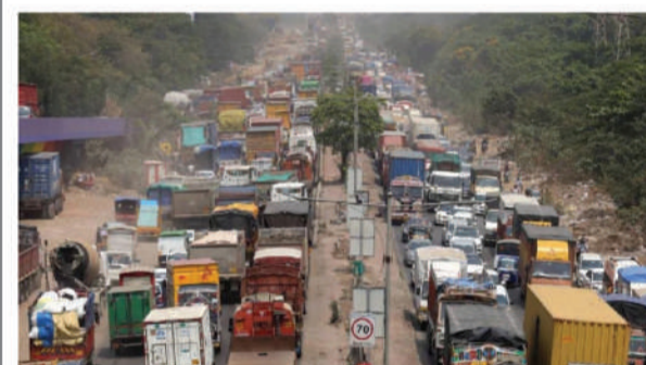
ठाणे, दि. २० : प्रतिनिधी

वाहतुक कोंडीमुळे ठाणेकर हैराण झाले असताना, पोलिसांच्या दुर्लक्षामुळे अवजड वाहनांची अवेळी वाहतुक पुन्हा एकदा सुरू झाली आहे. घोडबंदर मार्गावर अवजड वाहन चालक भरधाव वेगाने वाहन चालवित असल्याचे निदर्शनास येत आहे. त्यामुळे या अवजड वाहनांच्या वाहतुकीवर केव्हा वचक बसणार असा प्रश्न नागरिकांकडून विचारला जात आहे. ठाणे पोलीस आयुक्तालय क्षेत्रात ठाणे ते बदलापूर आणि भिवंडी शहरे येतात. या क्षेत्रातून मुंबई नाशिक महामार्ग, घोडबंदर, पूर्व द्रुतगती महामार्ग यासारखे महत्त्वाचे मार्ग जातात. भिवंडी शहरात गोदामांची संख्या मोठ्याप्रमाणात आहे. त्यामुळे