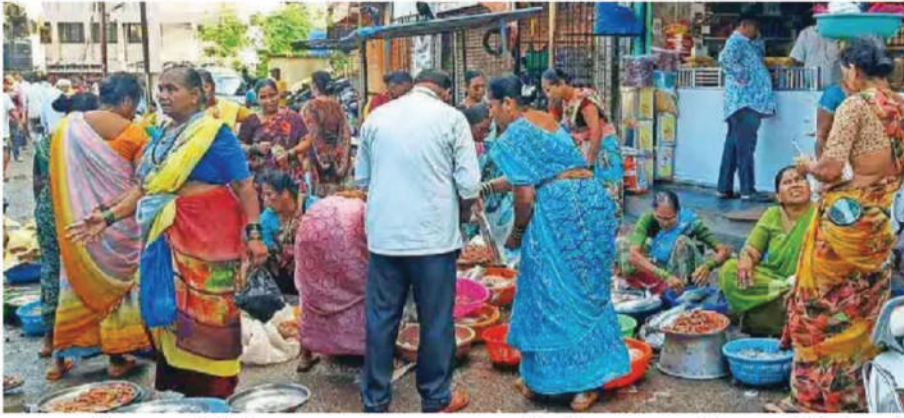
उरण, दि. २० : प्रतिनिधी

गणेशोत्सवात उपवासाचे दिवस संपताच उरणच्या मासळी बाजारात खरेदीसाठी बुधवारी खवव्यांची गर्दी झाली होती. ७ सप्टेंबरपासून गणपती उत्सव असल्याने व त्यापूर्वी श्रावण महिना सुरू होता. त्यामुळे अनेकांचे उपवासाचे दिवस सुरू होते. मात्र हे उपवास अनंत चतुर्दशीला संपले आहेत. त्यानंतर बुधवार हा पहिलाच दिवस आल्याने खवव्यांची मासळी खरेदीसाठी उरणच्या मासळी बाजारात गर्दी झाली होती.