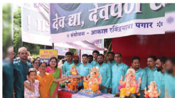
नाशिक, दि. २० : प्रतिनिधी

गणरायाला पर्यावरणरुनेही पध्दतीने निरोप देण्यासाठी महानगरपालिकेने राबविलेल्या उपक्रमात शहरात दोन लाख पाच हजार ८५४ मूर्तीचे संकलन करण्यात आले. तसेच सुमारे १७५ मेट्रिक टन निर्माल्य संकलन करण्यात आल्याचे महापालिकेने म्हटले आहे. गेल्या वर्षीच्या तुलनेत मूर्ती संकलनात साडेपाच हजारहून अधिक वाढ झाली.