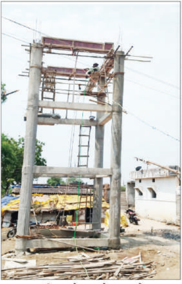
तालुक्यात दिसून येत आहे. त्यामुळे नागपूर जिल्ह्याचे पालकमंत्र्यांनी या जलमिशन योजने कडे लक्ष द्यावे अशी मागणी सर्वसामान्य नागरिकांमधून होत आहे. मौदा तालुक्यामध्ये

जल मिशन योजनेच्या माध्यमातून मौदा तालुक्यातील गावांमध्ये नवीन विहिरी, पाण्याच्या टाक्या, बोरवेल, सोलर वॉटर टँक, तर प्रत्येक घरी नळ कनेक्शन देऊन काल मर्यादित प्रकल्पाला पूर्णत्वास नेण्याकरिता स्थानिक लोकप्रतिनिधी, अभियंते, कंत्राटदार व ग्रामस्थ यांच्या समन्वयातून २०२४ पर्यंत तालुक्यात जल मिशन योजना ही लोक चळवळ होण्याच्या दृष्टीने मौदा तालुक्याला प्रत्येक गावात लाखो रुपये व कोटी रुपये अपेक्षित खर्च असून सुध्दा या योजनेकडे प्रशासनाच्या कमिशन बाजीमुळे दुर्लक्ष होत आहे. सन २०२४ संपत असताना अनेक ग्रामीण भागांमध्ये ना. नल. ना पाणी जलमिशन की अथुरी कव्हाणी अश्या रुपात जल मिशन योजनेची विदारक परिस्थिती