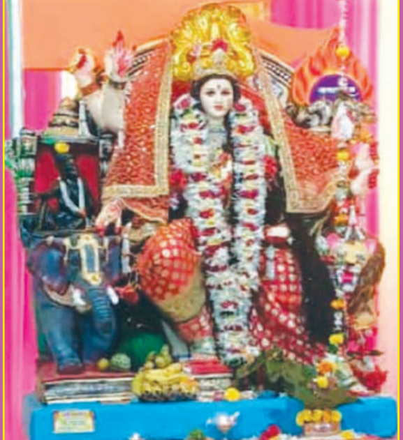
चांदूर बाजार -सार्वजनिक दुर्गा उत्सव मंडळ काजळी