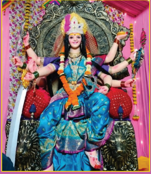
चांदूर बाजार -सत्यम दुर्गाउत्सव मंडळ, जसापूर