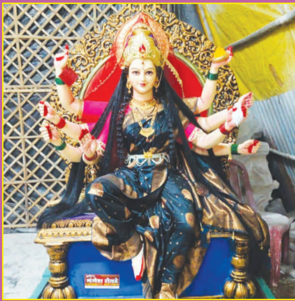
चांदूर बाजार-नूतन दुर्गाउत्सव समिती, सरदार वल्लभभाई पटेल चौक, चांदूर बाजार.