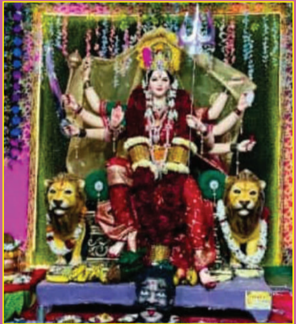
चांदूर बाजार-सार्वजनिक दुर्गा उत्सव मंडळ देऊरवाडा