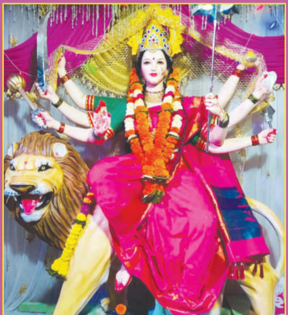
चांदूर बाजार-कार्तिक स्वामी दुर्गा उत्सव मंडळ माळीपुरा जसापूर