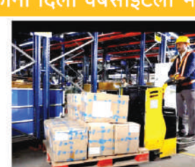
सणावाराचा मोसम आरंभवासक होणार असल्याची खात्री पटली आहे. मोबाइल, पोषक खाद्यपदार्थ, आणि मेकअपच्या उत्पादनांना वाढती मागणी दिसून आली आहे.

बंगलुरु- ३० सप्टेंबर , - फ्लिपकार्टचा बहुप्रतीक्षित बिग बिलियन डेज ची ११ वी आवृत्ती २७ सप्टेंबरला लॉंच झाली आहे. फ्लिपकार्ट व्हीआयपी आणि प्लस कस्टमर्ससाठी ही योजना एक दिवस आधीच सुरु झाली होती. अर्ली कसेट दे आणि पहिल्या दिवशी ३३ कोटीपेक्षा अधिक लोकांनी वेबसाइटला भेट दिली. यावरून सणावाराच्या दिवसातला ग्राहकांचा उत्साह दिसून येतो. सुरुवातीच्या टॅस्टरवरून हा