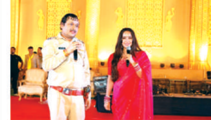
मालिका 'हप्पू की उलटन पलटन' मधील कलाकार आग्रा, भव्य राम बरातमध्ये सामील

असता (वर दिलेल्या तालिकेप्रमाणे मार्केट सायकल ६ च्या शीर्षस्थानी ), तर ३१ जुलै २०२४ पर्यंत त्यांनी छ १९.९ लाख गुंतवले असते आणि या गुंतवणुकीचे सध्याचे मूल्य ७४.७ लाख असते, जे १४.४% चा एक्सआयआरआर देते. तसेच, जर कोणीतरी मार्च २००९ मध्ये हा एसआयपी सुरु केली असती (वर दिलेल्या तालिकेप्रमाणे मार्केट सायकल ६ च्या तळाशी), तर ३१ जुलै २०२४ पर्यंत त्यांनी १८.५ लाख गुंतवले असते (पूर्वीच्या गुंतवणूकदारापेक्षा १.४ लाख कमी) आणि या गुंतवणुकीचे सध्याचे मूल्य ६३.८ लाख असते (पूर्वीच्या गुंतवणूकदारापेक्षा १०.९ लाख कमी) जे १४.७% चा एक्सआयआरआर देते. रिपोर्टमधील काही प्रमुख निष्कर्ष: हे लक्षात घेण्यासारखे आहे की मार्केट सायकलच्या तळाशी सुरु केलेल्या एसआयपीसाठी % रिटर्न थोडे अधिक आहे, परंतु रुपयांच्या बाबतीत विचार केल्यास वास्तविक लाभ (वेल्थ क्रिएशन) टॉपला सुरु केलेल्या एसआयपीसाठी खूपच जास्त आहे.