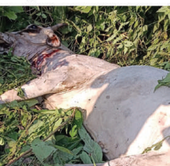
जखमी झालेल्या गाईचा शव