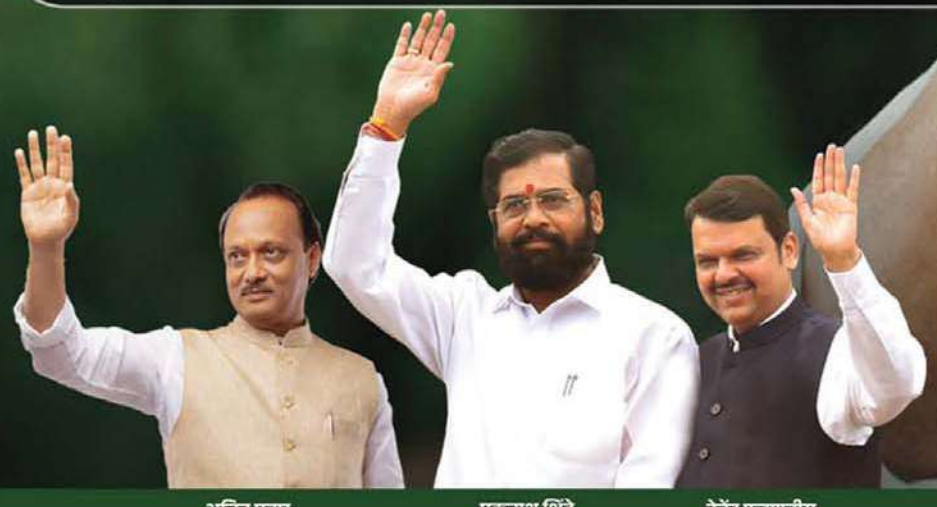
अजित पवार उपमुख्यमंत्री, एकनाथ शिंदे मुख्यमंत्री, देवेंद्र फडणवीस उपमुख्यमंत्री

ज्येष्ठ नागरिकांना महाराष्ट्रासह देशातील १३९ तीर्थक्षेत्रांना मोफत भेटीची व दर्शनाची संधी ६० वर्षे व त्यावरील ज्येष्ठ नागरिकांना योजनेचा लाभ प्रति व्यक्ती प्रवासासाठी ३० हजार खर्च मर्यादा सुमारे ३० कोटींचा निधी वितरीत