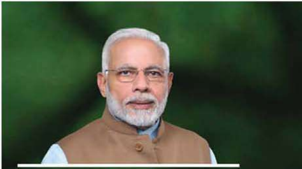
नरेंद्र मोदी प्रधानमंत्री

मंगळवारचे सर्वच कार्यक्रम रद्द ■ महासागर प्रतिनिधी, मुंबई, दि. ८ : मुख्यमंत्र्यांचे आजचे सर्व कार्यक्रम रद्द करण्यात आले आहे. मुख्यमंत्री एकनाथ शिंदे यांची तब्येत बरी नसल्याने मुख्यमंत्र्यांचे सर्व कार्यक्रम रद्द करण्यात आले आहे. सोलापूर दौरा आणि राज्यमंत्री मंडळाची बैठकही रद्द करण्यात आल्याची माहिती सूत्रांनी दिली आहे. शिंदे आज सोलापूर शहरात वचनपूर्ती सोहळ्यासाठी येणार होते. फर्मांचा सोलापूर दौरा आतापर्यंत पाचव्यांदा रद्द झाला आहे. इतर कार्यक्रमांची रद्द करण्यात आले.