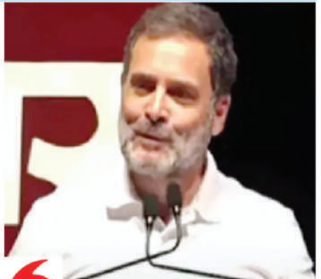
संविधान केवळ पुस्तक नाही तर जगण्याचा मंत्र