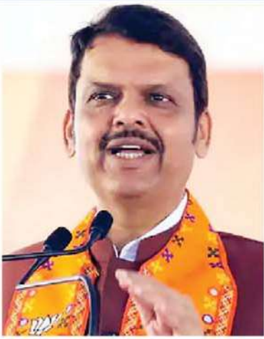
नितीन गडकरींच्या नेतृत्वात केंद्र आणि महाराष्ट्र सरकारच्या माध्यमातून आम्ही नागपूर शहर आणि नागपूर जिल्ह्याचा चेहरामोहरा बदलला आहे. मात्र, नागपूर जिल्ह्यातील १२ मतदारसंघांपैकी सावनेर

परिवर्तनाची यापेक्षा मोठी संधी तुम्हाला पन्मात मिळणार नाही. आता चुकलात तर पक्षातापाशिवाय काहीही हातात राहणार नाही, असेही फडणवीस म्हणाले.