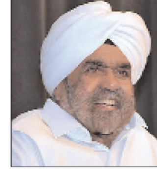
संत राजिंदर सिंह जी महाराज

हे सामान्य जनतेने ओळखले पाहिजे. भारताचे जगातील सध्याचे स्थान, देशाची गंगाजळी, देशातील भ्रष्टाचारावर येत असलेले नियंत्रण, होणारा चौफेर विकास हे कोणाला नको आहे, हे समजून घेतले पाहिजे. काही मंडळी परदेशीत जाऊन देशाची प्रतिमा मलीन का करतात? याचे कारण हेच आहे की नेतृत्व नाही, संघटन नाही, ध्येयवाद नाही मग उरतो एकच मार्ग, अराजकता निर्माण करण्याचा, असंतोष निर्माण करण्याचा, मी काही करणार नाही पण तुझ्या कोणत्याही प्रयत्नांना बदनाम करून ते हाणून पाडीन, असा हा प्रकार आहे. पण सामान्य माणूस ओळखून आहे की अशी जी आंदोलने होतात ती निवडणूक संपली की संपून जातात, आरे कार शोड उभी राहण्यास अडीच वर्षे उशीर झाला, कोकणातील प्रकल्प सुरू झाले नाहीत याचे उत्तरही तो शोधतो. अराजकता हीच स्वभाव आजकड आहे आणि म्हणूनच भारतात अराजकता जिंकू शकत नाही. तरीही लोकांनी सावध राहणे गरजेचे आहे.