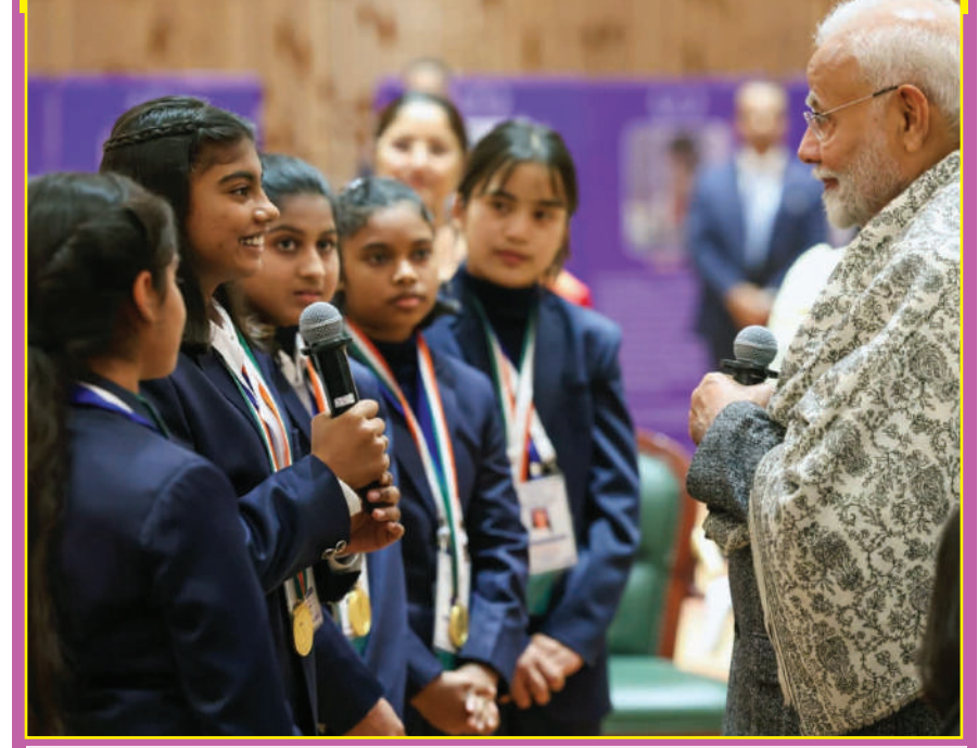
अमरावती-प्रधानमंत्री नरेंद्र मोदी यांनी प्रधानमंत्री राष्ट्रीय बाल पुरस्कार प्राप्त विजेत्यांशी दिल्लीतील भरतमडपम येथे मनमोकळ्या गप्पा मारल्या.