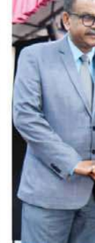
केंद्रीय मंत्री नितिन गडकरी यांची माहिती