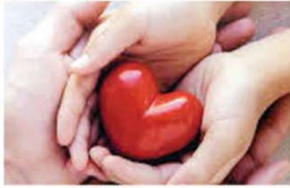
प्रस्तावित केंद्राची आरोग्य विभागाकडून पाहणी