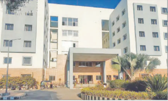
आहे. याच दिवशी रुग्णालयातील आंतरविभागात ऑनजिओप्लास्टीची पहिली शस्त्रक्रिया करण्यात येणार आहे.

तालुका स्तरावर मूलभूत, अल्पसंख्याक विकास, सामाजिक न्याय, तांडा वस्ती तसेच जिल्हा वार्षिक योजना निधी अंतर्गत गावातील जनसुविधा योजना त्वरित जाईचे वितरण करावे आदी सूचना दिल्या. या बैठकीला या अधिकाऱ्यांसह सर्वच विभागाचे अधिकारी आणि कर्मचारी, सरपंच, मोट्या संख्येने उपस्थित होते.