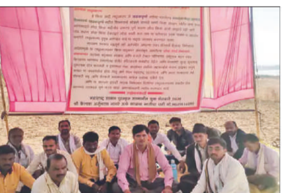
प्रकल्प, शिवणी आरमाळ शिवारातील शिवणी आरमाळ लघु प्रकल्पामध्ये खडकपूर्णा धरणातून अतिरिक्त पाणी नदीत सोडले जाते. हे पाणी डाव्या बाजूच्या कालव्यात जात नसल्याने या भागातील शेतकडे

अंदेरा येथील रामेश्वर लघु प्रकल्प तसेच गुंजाळ परिसरातील आसोला, अंदेरा, गुंजाळ लघु प्रकल्प, मेंडगाव परिसरातील लघु