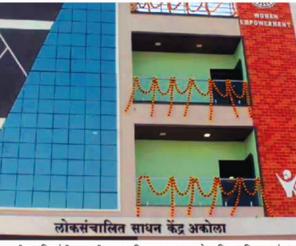
लोकसंचालित साधन केंद्र अकोला

महिला आर्थिक विकास महामंडळांतर्गत लोकसंचालित साधन केंद्र व बचत गटांतील महिलांच्या योगदानातून अकोल्यात तेजस्विनी भवन उभारण्यात आले आहे. या उपक्रमाच्या माध्यमातून महिला बचत गटांच्या चळवळीला बळ मिळणार आहे.