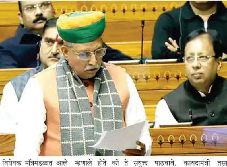
हे विधेयक मंत्रिमंडळात आले होते की ते संयुक्त पाठवावे. कायदामंत्री तसा तेव्हा पंतप्रधान नरेंद्र मोदी संसदीय समितीकडे (जेपीसी) प्रस्ताव देऊ शकतात.

याच्या निषेधार्थ सपा खासदार धर्मेद यादव म्हणाले की, वन नेशन, वन इलेक्शन विधेयक हे देशात हुकूमशाही आणण्याचा भाजपचा प्रयत्न आहे. एक राष्ट्र, एक निवडणूक विधेयक पुन्हा सादर करण्यासाठी प्रथमच इलेक्ट्रॉनिक पद्धतीने मतदान झाले. यामध्ये बाजूने 220, तर विरोधात 149 मते पडली. एकही खासदार गैरहजर नव्हता. एकूण 369 सदस्यांनी मतदान केले. यानंतर विरोधी सदस्यांनी आक्षेप घेतला. त्यांचा आक्षेप असेल तर त्यांना स्लिप द्या, असे शहा म्हणाले. यावर स्पीकर म्हणाले की, आम्ही आधीच सांगितले होते की, जर एखाद्या सदस्याला तसे वाटले तर तो स्लिपच्या माध्यमातून मत बदलू शकतो.