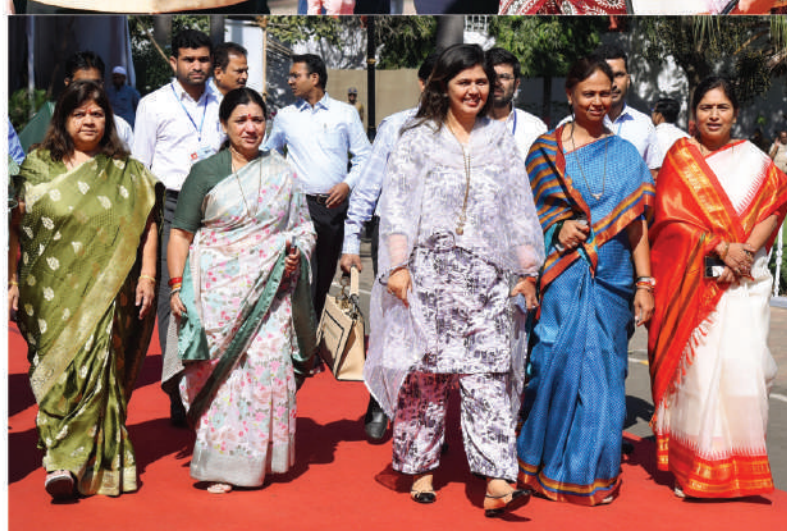
■ नागपूर : हिवाळी अधिवेशनाच्या दुसऱ्या दिवशी शिवसेना प्रमुख तथा माजी मुख्यमंत्री उद्धव ठाकरे यांनी विधिमंडळ परिसरात हजेरी लावली. विधानपरिषद सदस्य आमदार चित्रा वाघ यांनी हसतमुखाने प्रसार माध्यमांशी संवाद साधला. मंत्री पंकजा मुंडे या पक्षाच्या सहकारी महिला आमदारांसोबत सभागृहात दाखल झाल्याचे दिसून आले.