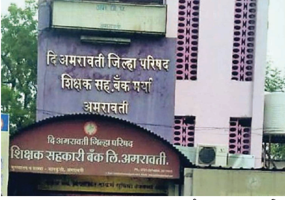
गुन्हा दाखल करण्यात आला आहे.

महासागर प्रतिनिधी अमरावती, (दि. 14) - जिल्हा परिषद शिक्षक सहकारी बँकेत घेण्यात आलेल्या पद भरती प्रक्रियेत अनियमितता झाल्याचा धक्कादायक प्रकार राजापेट पोलीस ठाण्यात दाखल झालेल्या तक्रारीवरून पुढे आला आहे. यापूर्वी या तक्रारीच्या अनुषंगाने आर्थिक गुन्हे शाखेकडे तपास सुरु होता. तपासानंतर 13 डिसेंबर रोजी राजापेट पोलीस ठाण्यात तक्रार दाखल करण्यात आली. तक्रारीच्या आधारे हमालपुरा येथील अमरावती जिल्हा परिषद शिक्षक बँकेचे अध्यक्ष व सोलापूर जिल्हा नागरी सहकारी बँकेचे अध्यक्ष व मुख्य कार्यकारी अधिकारी यांच्यासह तत्कालीन संचालक मंडळाच्या सर्व सदस्यांविरुद्ध फसवणुकीचा